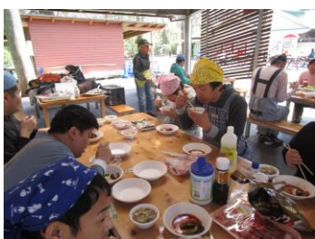
おいそうに食べてます

今年も恒例の、清水公園バーベキューに行ってきました。利用者の皆さんは、前日の食料買い出しから、ウキウキ。ワクワク。四月一四日バーベキュー当日は天気にも恵まれ、楽しいひと時でした。食材を切ったり、薪で火を焚いてスープを作ったり、準備から自分たちで行うのが、「千草園のルール。」余るはずの大量のお肉もすべて平らげ、締め焼きそば？中華スープと外での食事を満喫しました。食べ疲れたのか片付けは、のんびりでしたが、アウトドアを満喫した一日でした。