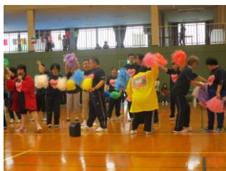
みんなリリ、応援合戦！

五月一三日に、『こしがや希望の里体育祭』が行われました。『希望の里さん』『おぎしま園さん』と『千草園』が集まり、総勢一五〇人あまりで盛大に開催されました。我が千草園はここ数年優勝を逃し、今年も準優勝。と、残念な結果でしたが、利用者の皆さんは、真剣な表情で競技に臨んでいました。優勝旗は手に出来ませんでした。したが、何より『交流』という素敵な時間を頂きました。